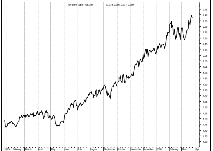
Dünya bakir fiyatları 2005-2006